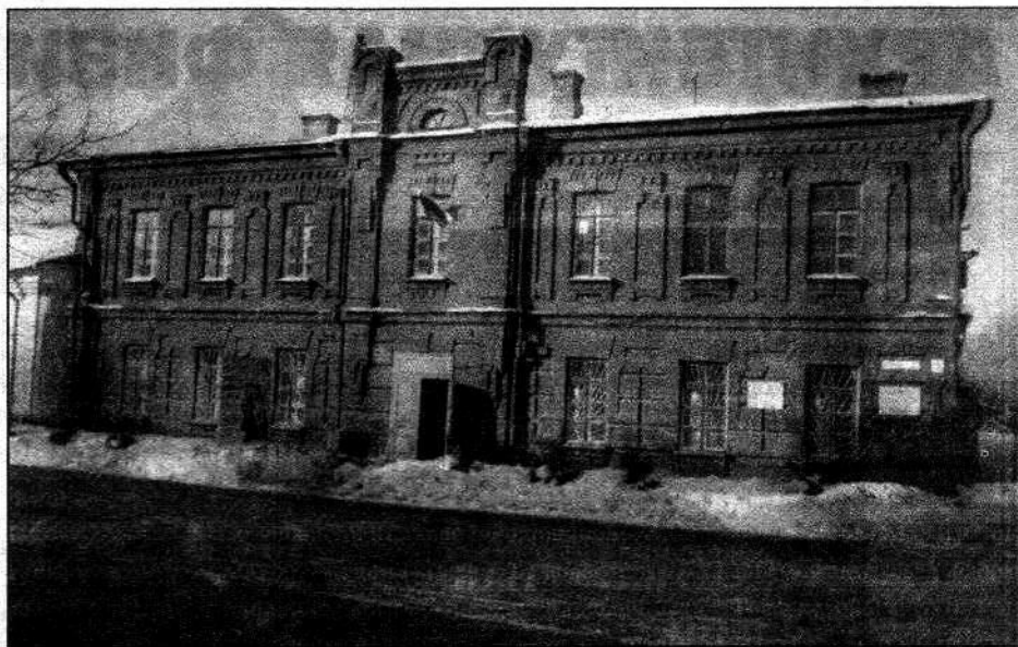
Второе здание штаба на ул. Таубе