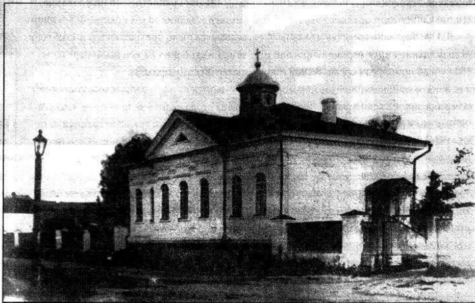
Лютеранская церковь Святой Екатерины – одно из самых старых каменных зданий в Омске. Фото до 1908 г.

Третьим кирпичным зданием, возведенным на восточной стороне площади плаца-парадов, была лютеранская церковь во имя Св. Екатерины на 100 мест. Ее построили в 1790–1792 годах на добровольные пожертвования военных-лютеран гарнизона. Этим и объясняется ее расположение в крепости. Содействовал строительству кирхи начальник Сибирской инспекции – укрепленной Сибирской линии генерал-поручик Г. Э. фон Штрандман.