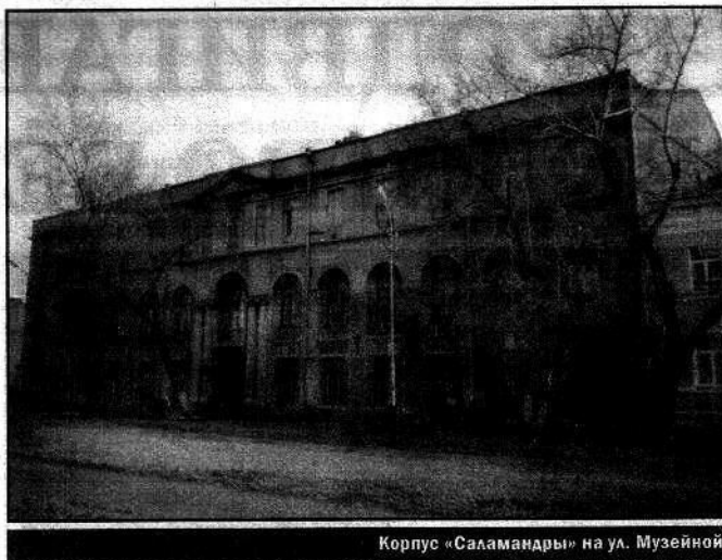
Корпус «Саламандры» на ул. Музейной

По-столичному монументальные строения выполнены в хороших архитектурных традициях с отличной разработкой пластики стены. Облицовка фасадов имитирует каменную кладку. Наружные стены толщиной не менее чем в 2,5 кирпича покоятся на таком же ленточном фундаменте глубокого заложения. Цоколь облицован гранитом, дающим ощущения основательности и надежности. Оформление обоих фасадов симметрично и выполнено почти одинаковыми архитектурными элементами. Центром композиции главного фасада является вход, акцентированный узорчатым карнизом, который опирается на пилястры. Выше расположена глубокая арка, увенчанная массивным фронтом. На его внутренней стене изображена рельефная фигурка саламандры. Этот приём характерен для стиля модерн. Над эмблемой видны следы от надписи «Саламандра», выполненной отдельными буквами по радиусу. Вероятно, их сорвали после национализации здания. В целом же строение получилось настолько высоким, что потребовало надстройки башни пожарной ка-