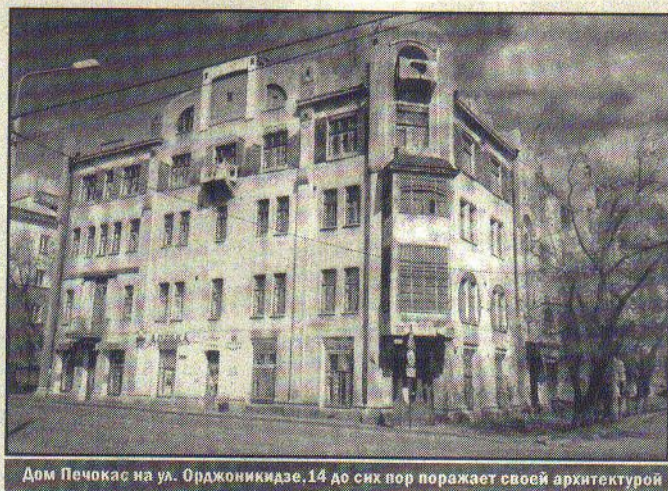
Дом Печокас на ул. Орджоникидзе, 14 до сих пор поражает своей архитектурой

Среди многочисленных памятников старый четырёхэтажный угловой дом на ул. Орджоникидзе, 14 вот уже более девяти десятков лет поражает горожан своей необычной архитектурой и отделкой, а также не дает покоя кладоискателям.