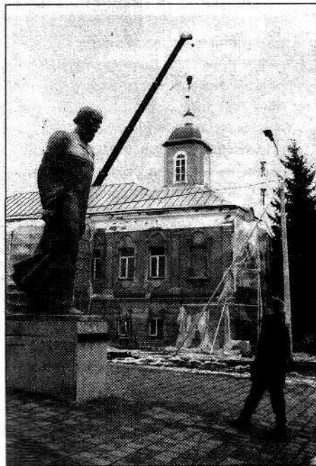
Все основные работы по восстановлению здания ведет строительная фирма «Полет и К».

Преобразования коснулись и Шпрингеровской улицы, на которой стоит здание бывшей гауптвахты. В 1916 году на плацу Омской крепости заложили Сад офицеров — сейчас в нем расположен Выставочный сквер, где проходят сезонные выставки «Флора». После установления советской власти имя основателя Омской крепости генерал-поручика Ивана Шпрингера было забыто. В 1920 году улицу