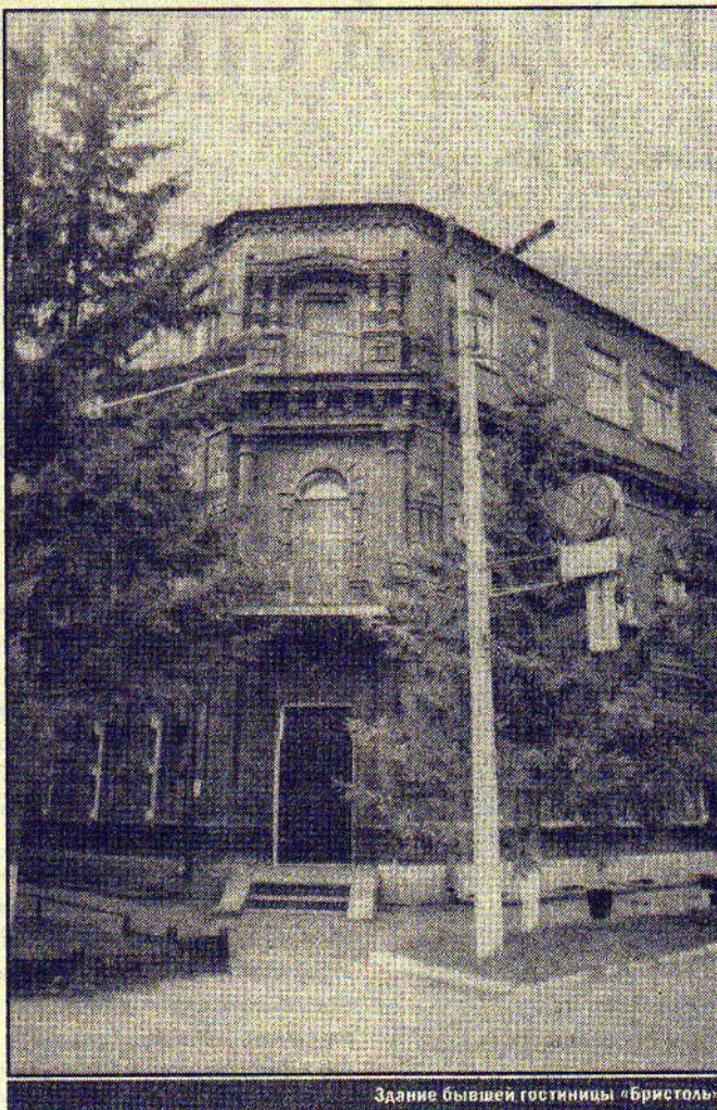
Здание бывшей гостиницы «Бристоль»

Торговый дом Эннса несомненно самый красивый на Сенной. Кирпичный двухэтажный корпус занимает площадь размером 18 на