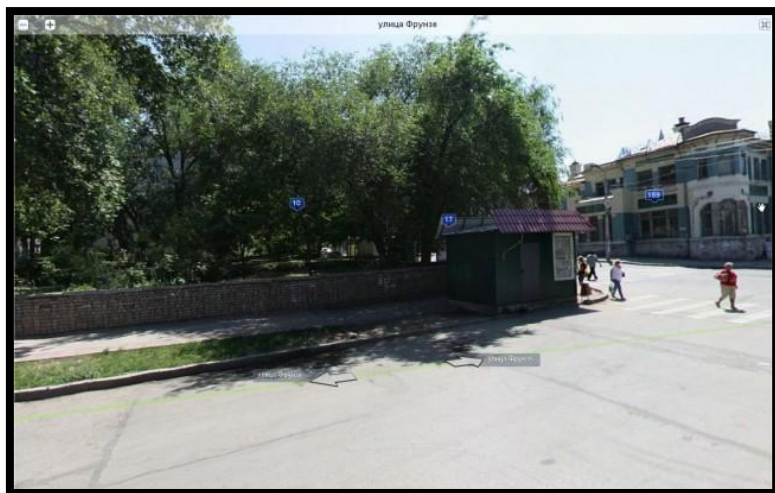
Сквер Аксакова на пересечении улиц Фрунзе и Красноармейская.

Увы, в советское время его имя надолго было вычеркнуто из истории края, и только два года назад усилиями Аксаковского фонда на бывшем губернаторском доме, изувеченном, как ни прискорбно, ныне модным евроремонтом, появилась мемориальная доска.