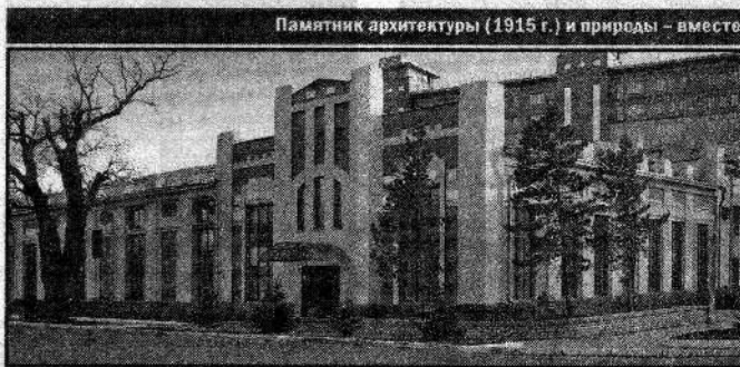
Памятник архитектуры (1915 г.) и природы – вместе