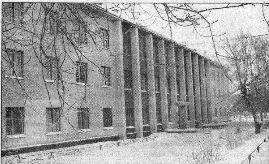
Второй фасад Дома радио (со стороны пр. Мира)

На иртышском фасаде стеклянная дверь. Здесь же установлен барельеф в виде волнообразного красного флага, символизирующего радиоволны. Его видно с моста через Иртыш им. 60-летия ВЛКСМ. Со стороны проспекта Мира по центру установлена парадная массивная дубовая дверь, не пропускающая уличный шум.